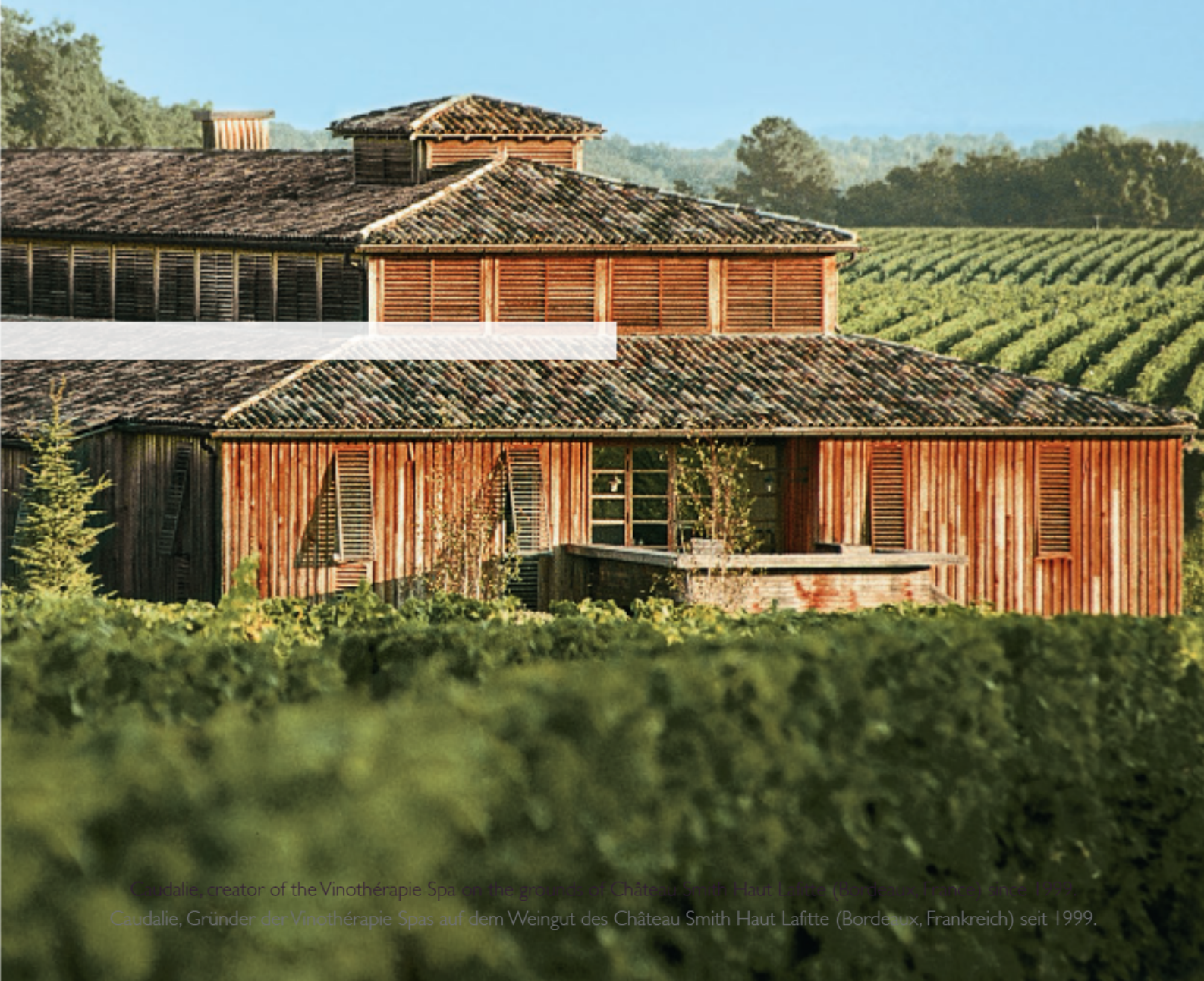
Caudalie, creator of the Vinotherapie Spa on the grounds of Château Smith Haut Lafitte (Bordeaux, France) since 1999. Caudalie, Gründer der Vinotherapie Spas auf dem Weingut des Château Smith Haut Lafitte (Bordeaux, Frankreich) seit 1999.