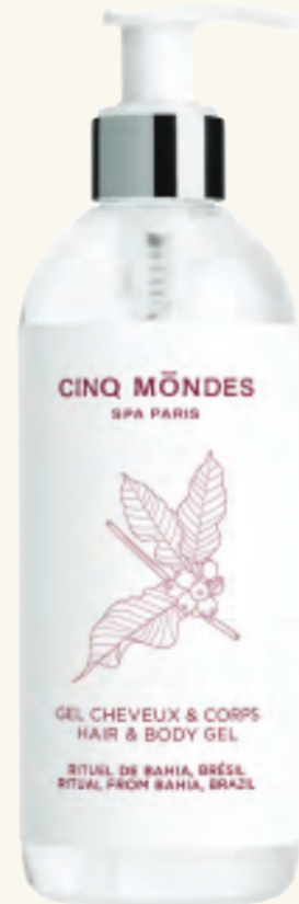
HAIR & BODY GEL Haar- und Körper Shampoo

Wall brackets in chrome plated-brass or white recyclable ABS plastic.