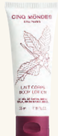
BODY LOTION Bodylotion