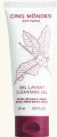
CLEANSING GEL Reinigungsgel