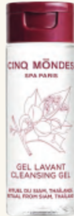
CLEANSING GEL Reinigungsgel