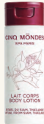
BODY LOTION Bodylotion