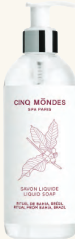
LIQUID SOAP Flüssigseife