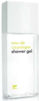
SHOWER GEL Duschgel