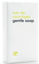
SOAPS Seife allegro 1.23 oz / Allegro 35 g cardboard box 0.88 oz / Kartonage 25 g