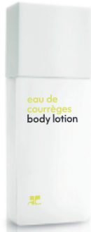
BODY LOTION Bodylotion